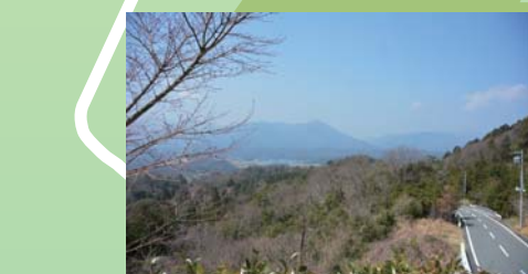
コースから望む鈴鹿の山並み