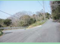
タイトな道幅のヘアピンカーブ