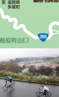
大会本部・ゴール 地点の農業公園